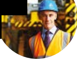
Technicien en hygiène et sécurité